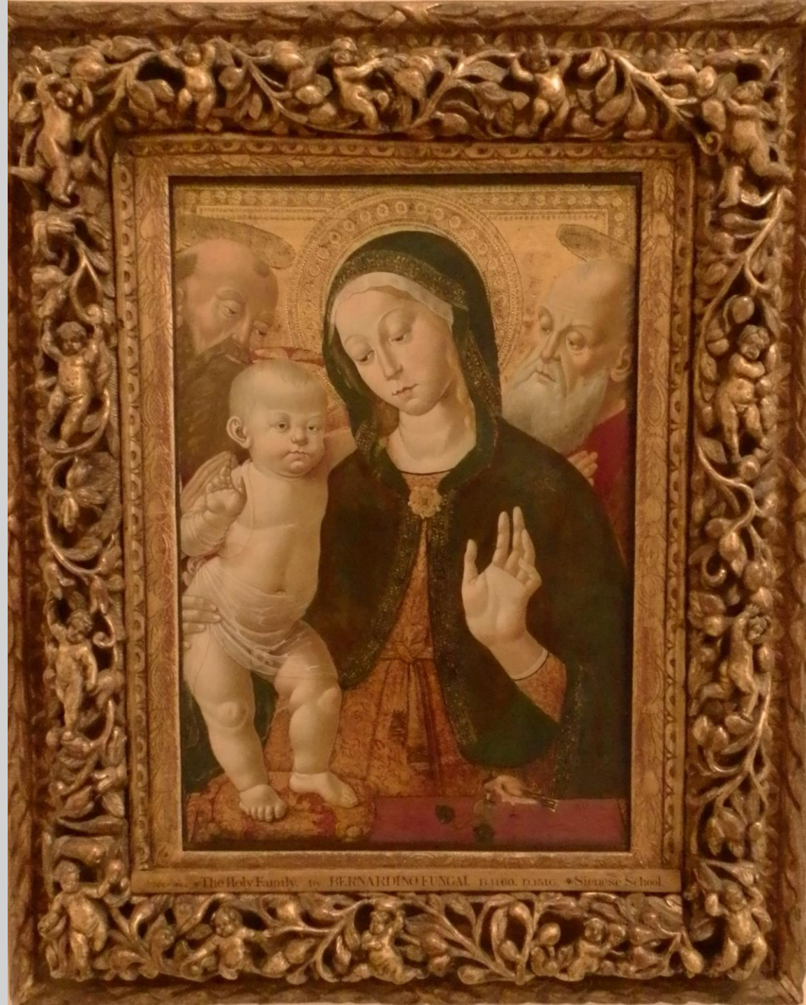
The Holy Family by BERNARDINO FUNGAI, 1460, 1460. • Sienese School